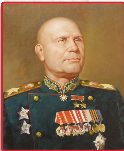
Конев Иван Степанович 1897–1973 Советский полководец, Маршал Советского Союза, дважды Герой Советского Союза, кавалер ордена «Победа»

Какие ошибки человека в мирное время приводят к войне?