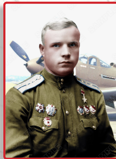
Клубов Александр Фёдорович 1918–1944 Советский лётчик-ас, участник ВОВ, дважды Герой Советского Союза