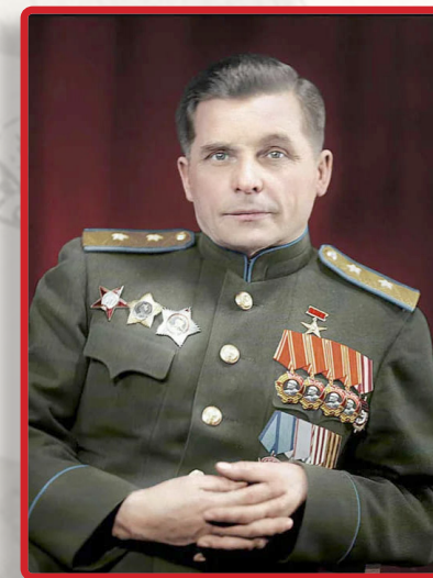
Ильюшин Сергей Владимирович 1894–1977 Советский авиаконструктор, Трижды Герой Социалистического Труда, Генерал-полковник инженерно-технической службы. Академик АН СССР